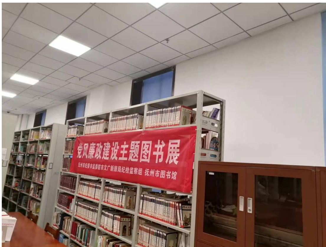
党风廉政建设主题图书展