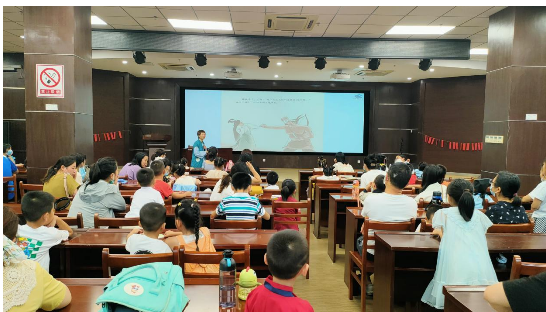
市图书馆三楼报告厅开展“月满中秋 共享欢乐”亲子活动