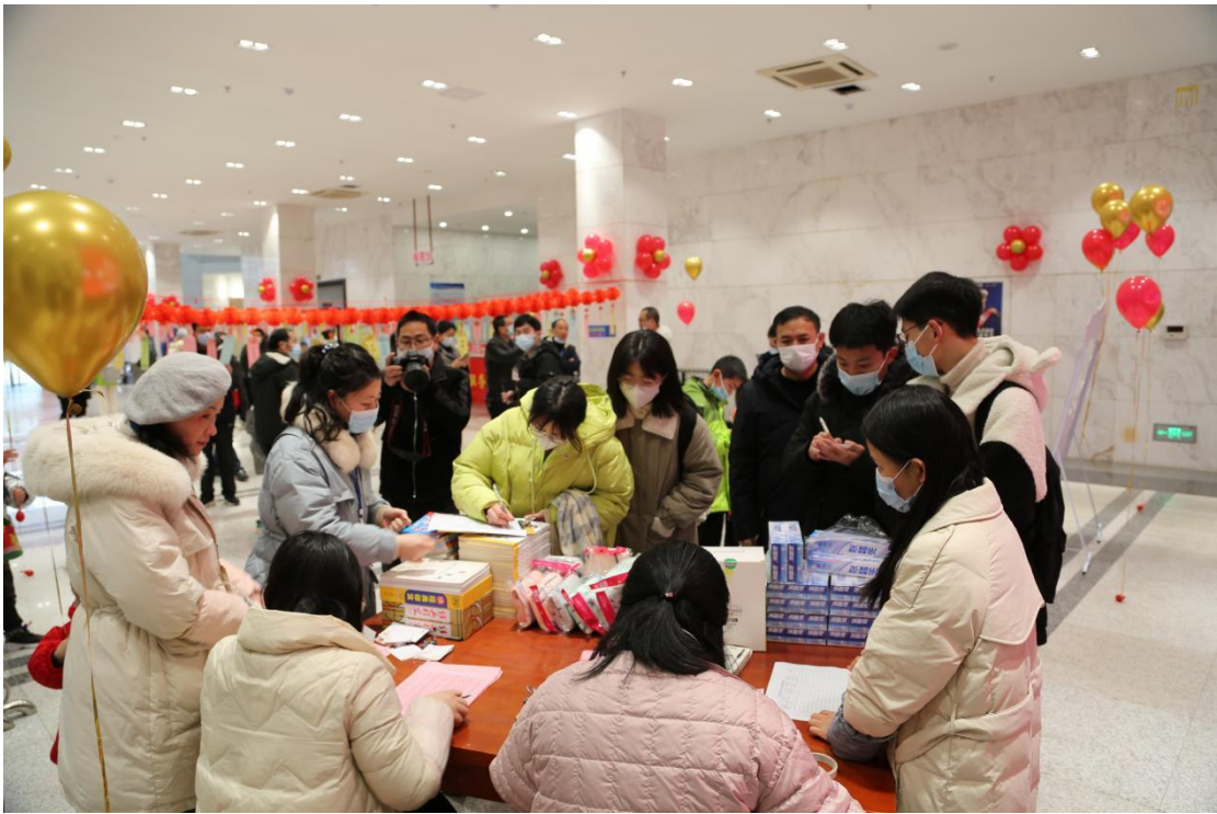
市图书馆一楼举办“闹元宵，猜谜语”活动