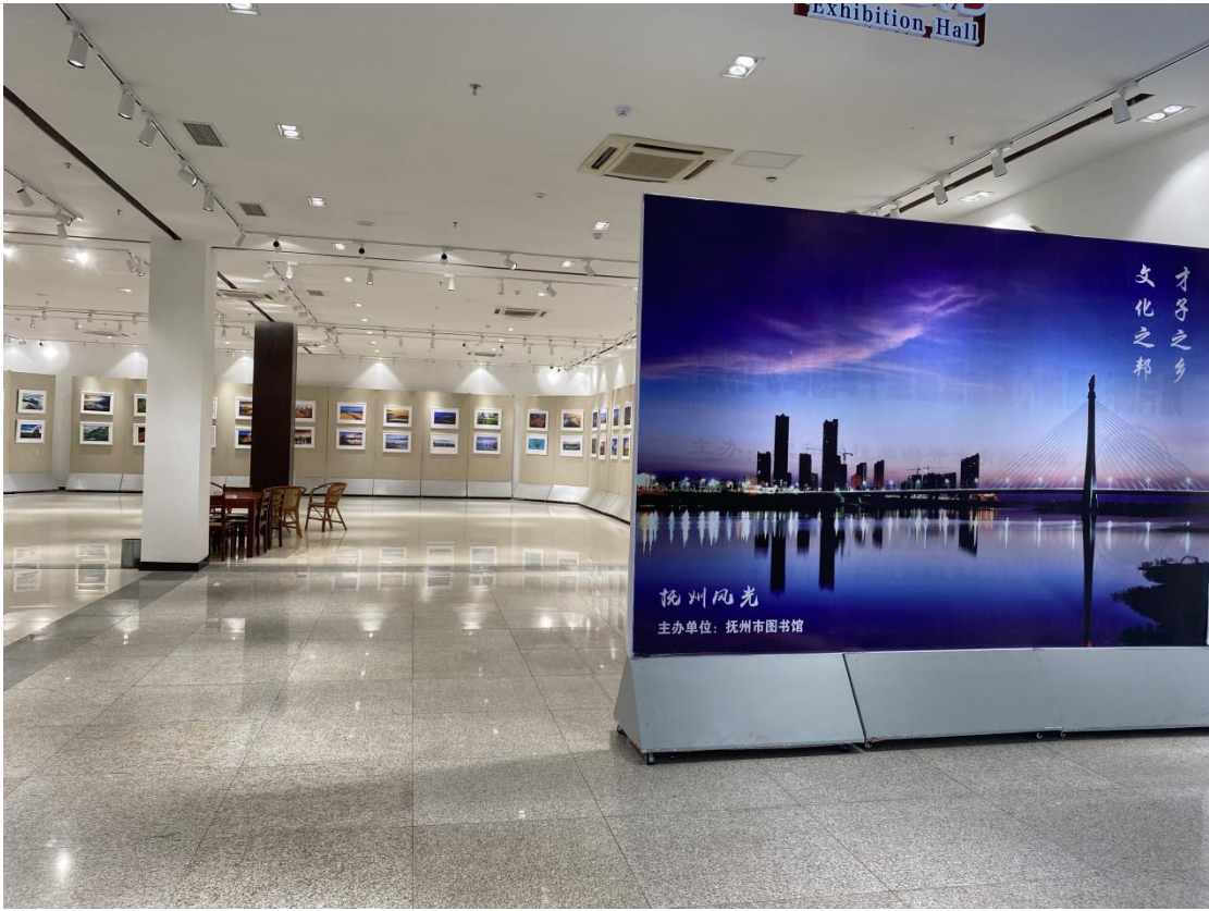
“抚州风光”摄影图片展