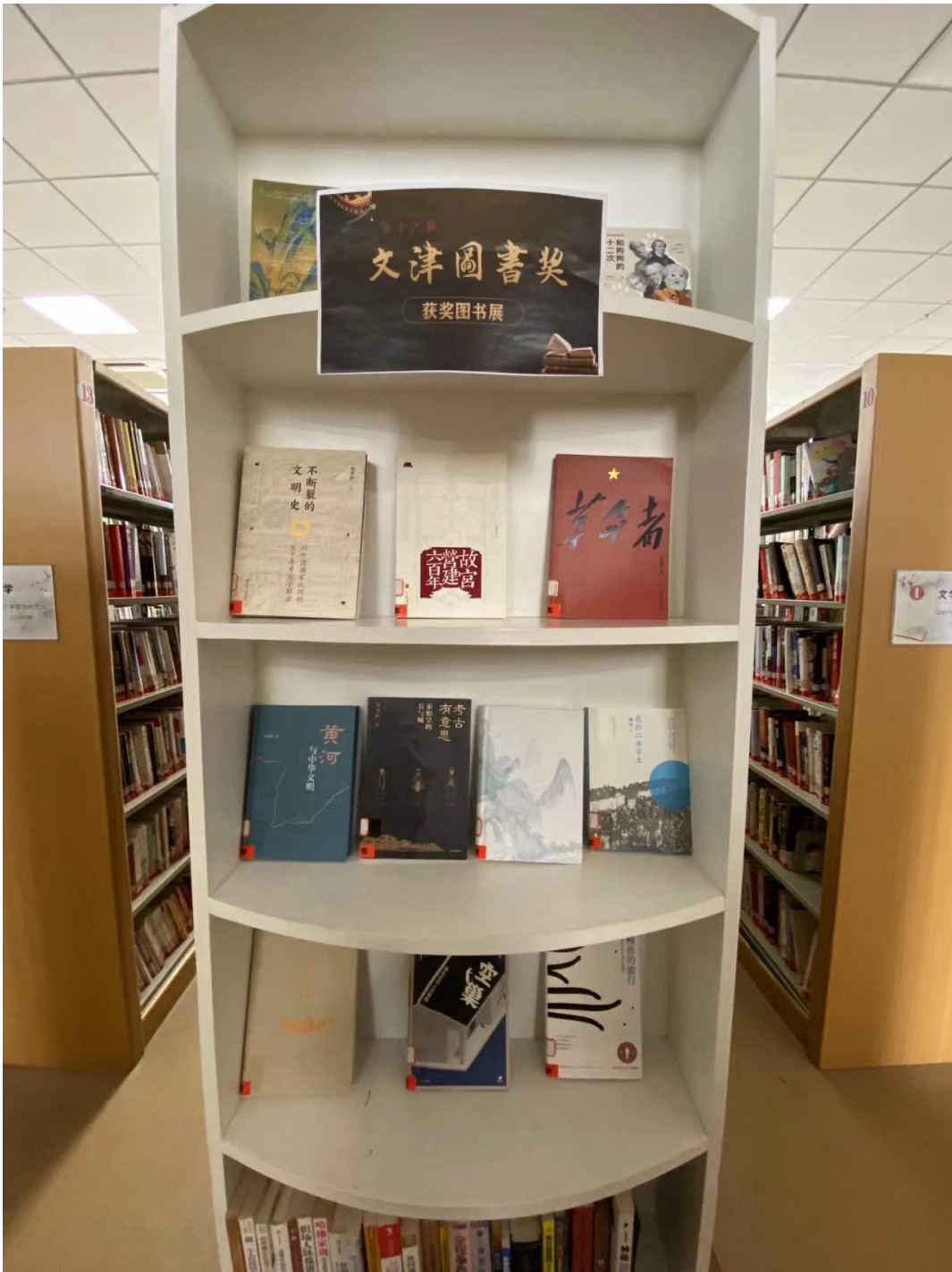
“文津图书奖”专题书架展