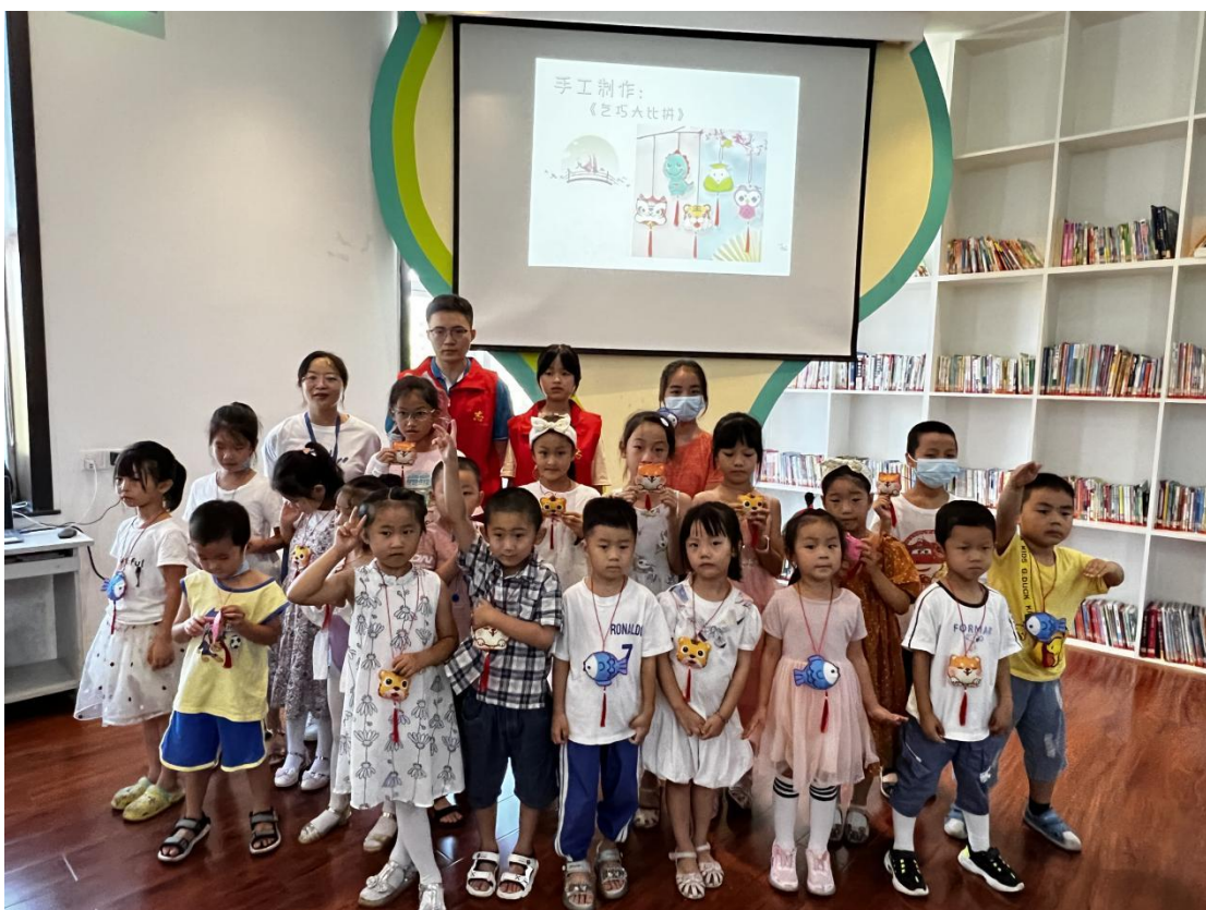
在市图书馆二楼数字体验馆开展七夕手工活动