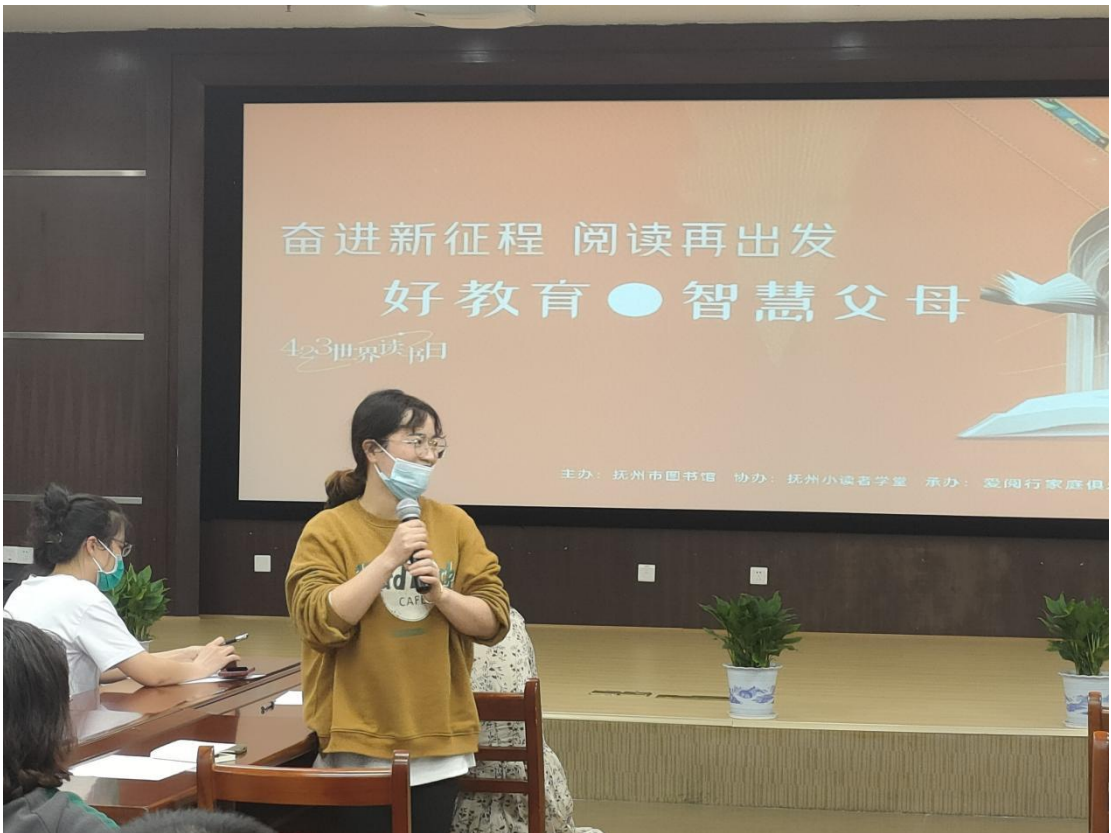
(开展“好教育·智慧父母”课堂活动)