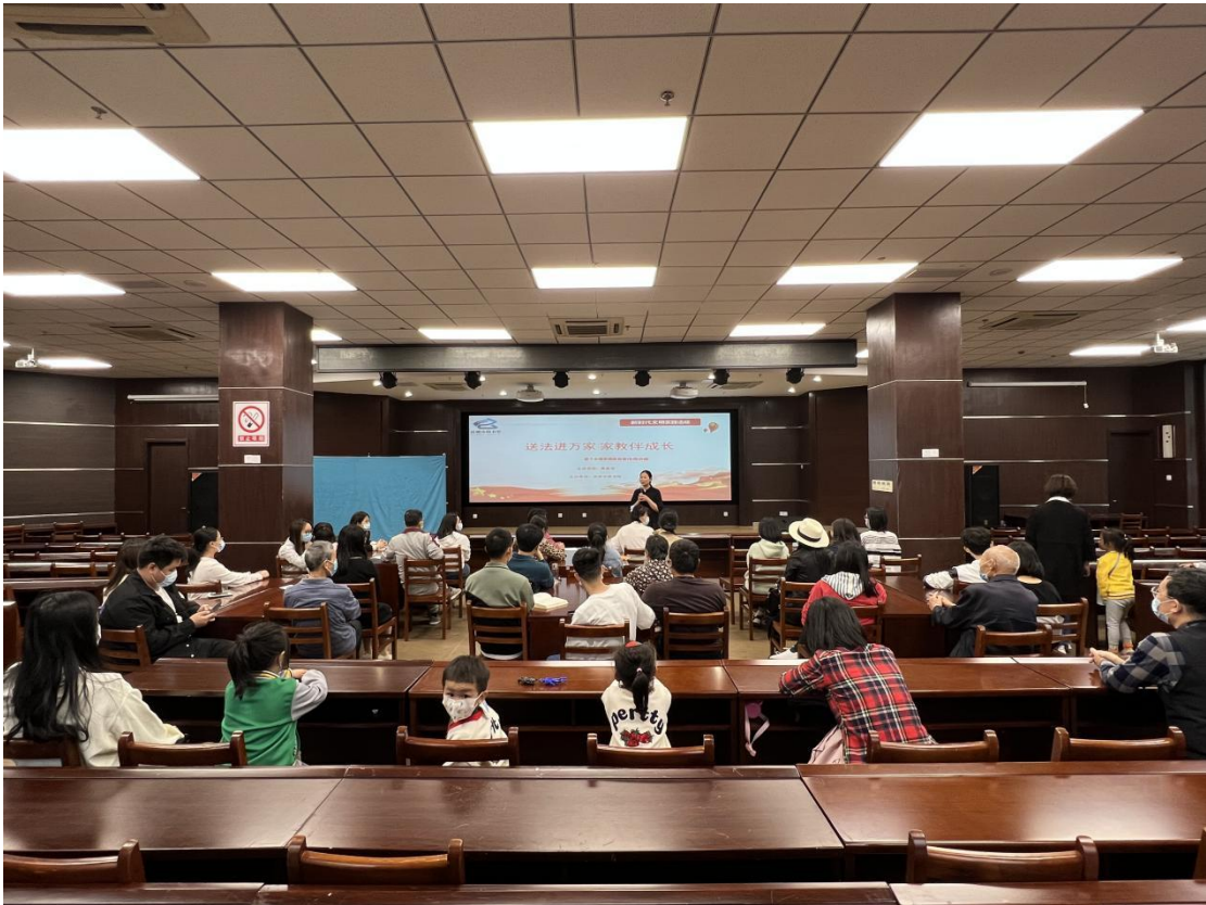
(5月14日下午, 在市图书馆三楼报告厅开展“送法进万家 家教伴成长”首个全国家庭教育宣传周讲座)