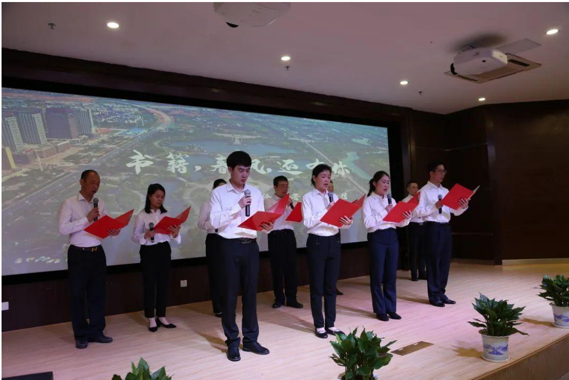
(开展“奋进新征程，阅读再出发”读书活动)