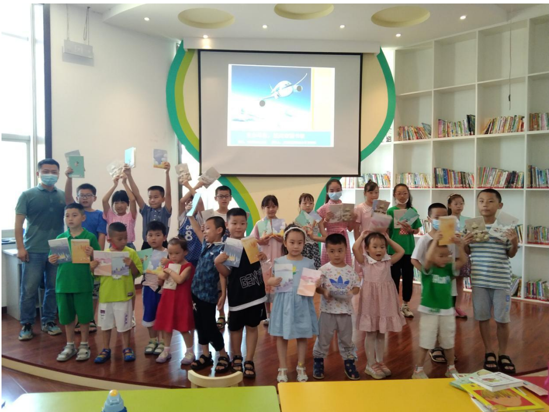
（7月10日上午，在市图书馆二楼数字体验馆开展“童心向党 科技筑梦”科普活动）