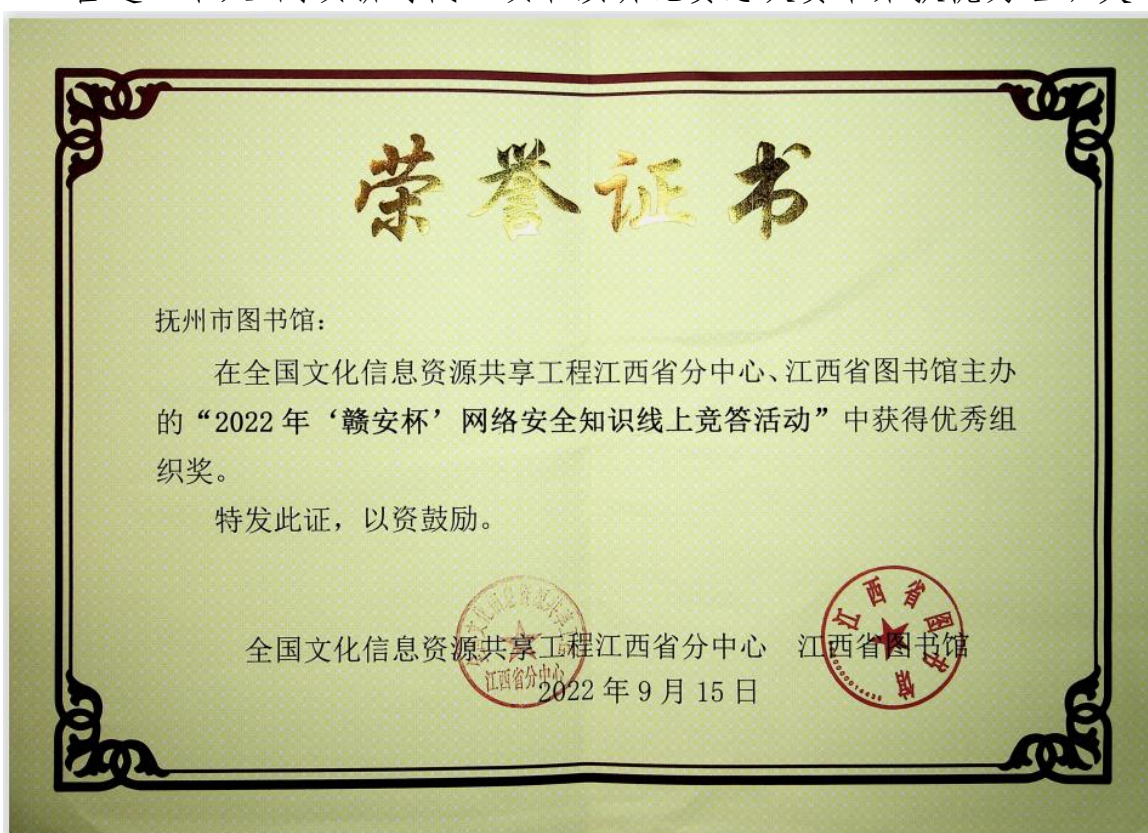
“2022年‘赣安杯’网络安全知识线上竞答活动中荣获“优秀组织奖”