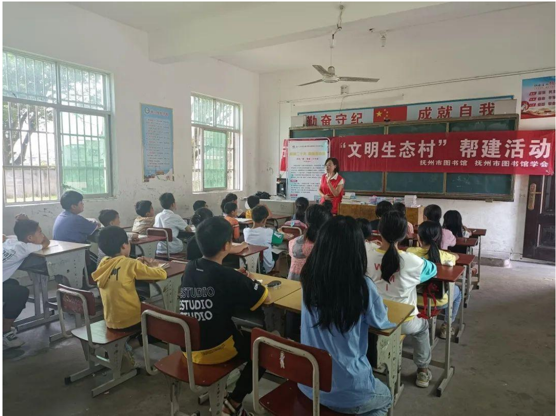
前往金溪县浒湾镇丁家村开展“生态文明村”帮建活动