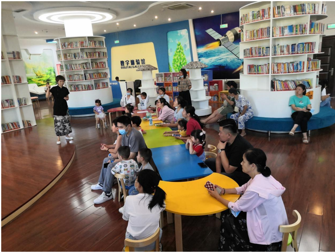
开展情系重阳节敬老活动《汤姆爷爷》