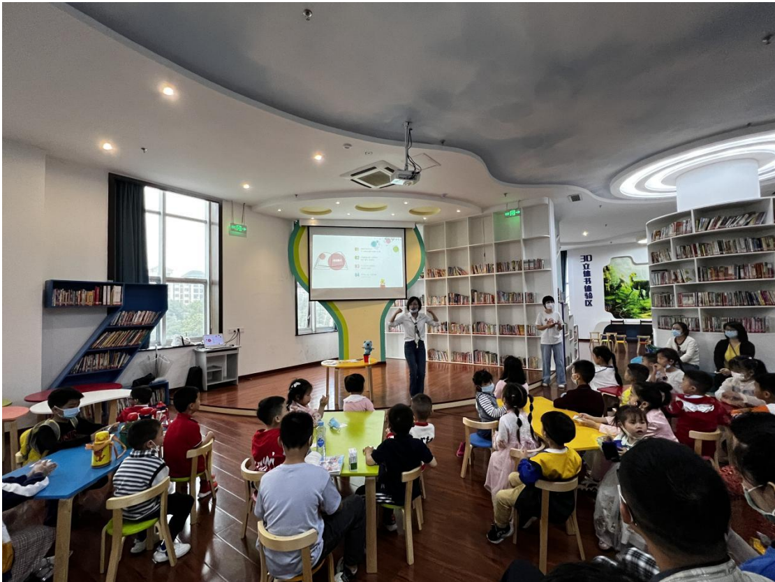
(5月22日上午,在市图书馆二楼数字体验馆开展“吃什么你就是什么”科普活动)