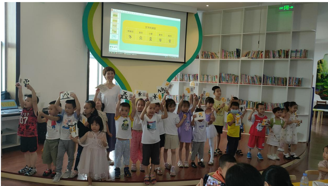
(9月17日上午,在市图书馆二楼数字体验馆开展“汉字是画出来的”科普活动)