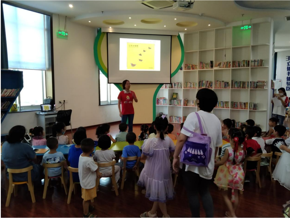
(8月13日上午,在市图书馆二楼数字体验馆开展“迁徙的蝴蝶”科普活动)