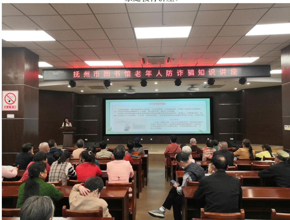
(10月30日上午，在市图书馆三楼报告厅开展“反诈防骗，敬老助老”知识讲座)