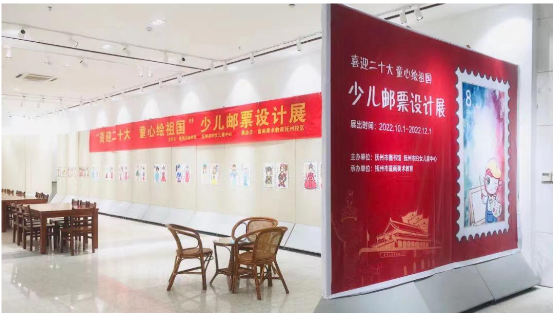
“喜迎二十大 童心绘祖国”少儿邮票设计展