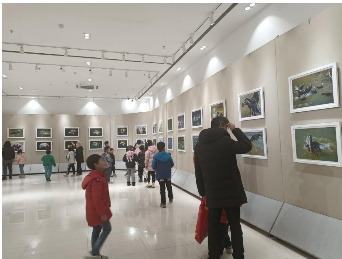
“家和飞鸟与十里桃源健康小镇” 摄影图片展