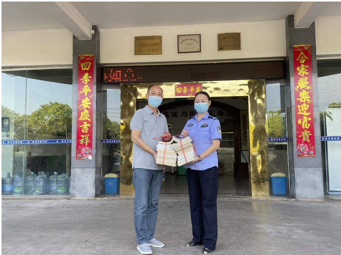
送书到看守所分馆