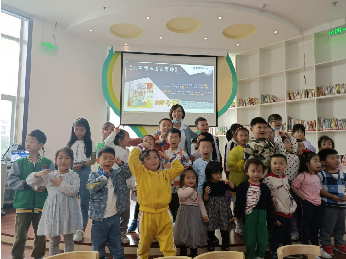
(5月22日上午,在市图书馆二楼数字体验馆开展“力学原来这么有趣”科普活动)