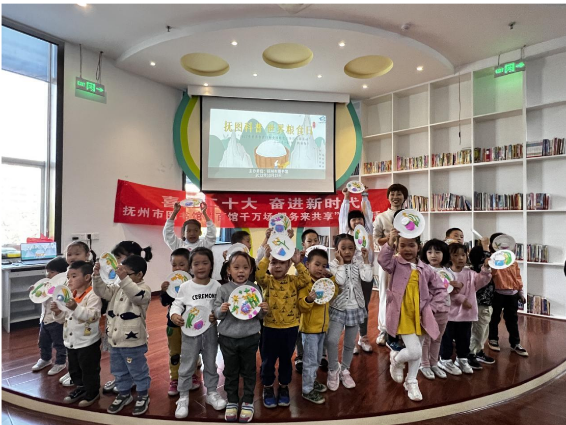
(10月15日上午,在市图书馆二楼数字体验馆开展“一粒种子的旅行”科普活动)