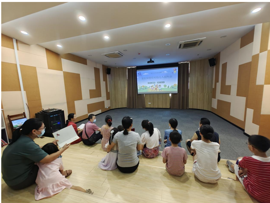
(9月11日上午，在市图书馆四楼少儿绘本馆开展“家长如何处理孩子入园焦虑”家庭教育讲座)