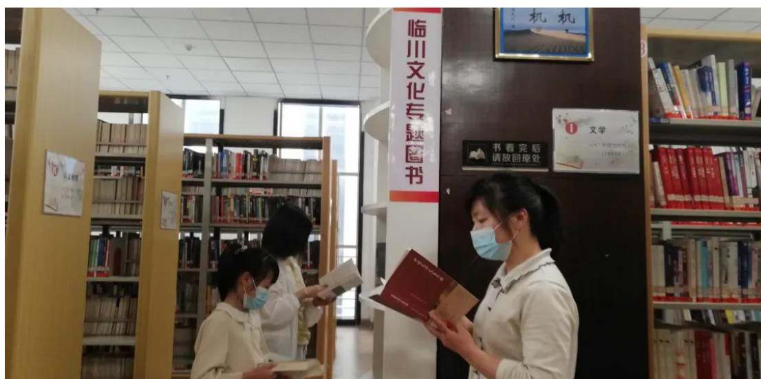
抚州地方文献书籍展