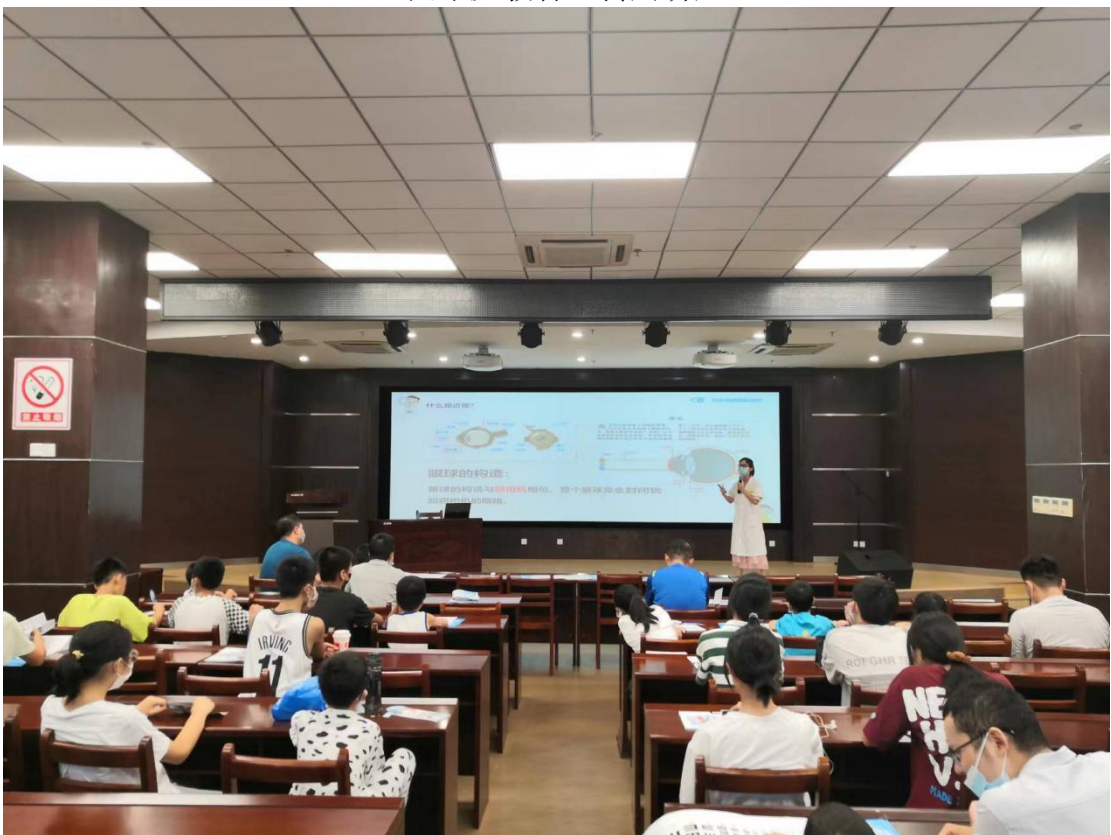
(8月21日上午, 在市图书馆三楼报告厅开展“科学防控近视, 共筑光明未来”公益讲座)