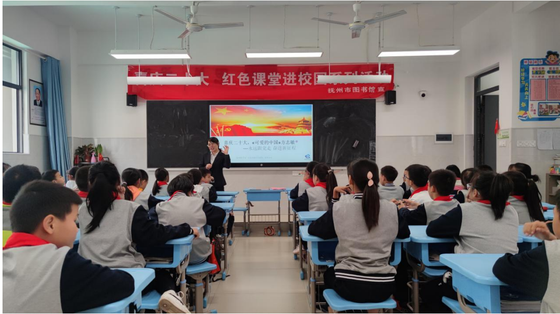
(11月1日上午,市图书馆走进抚州市高新第二小学开展红色课堂进校园活动《可爱的中国》方志敏事迹)