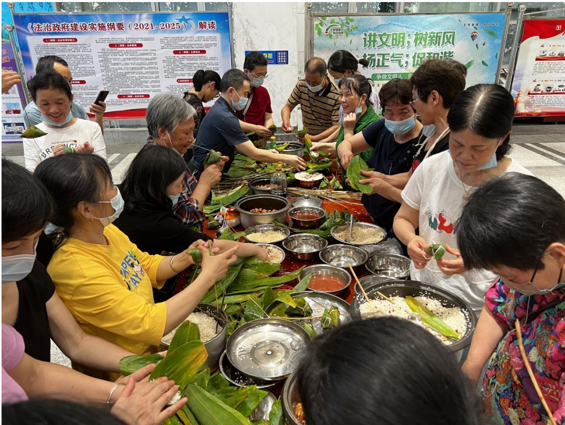
市图书馆一楼大厅开展“粽叶飘香 全民过端午”包粽子比赛