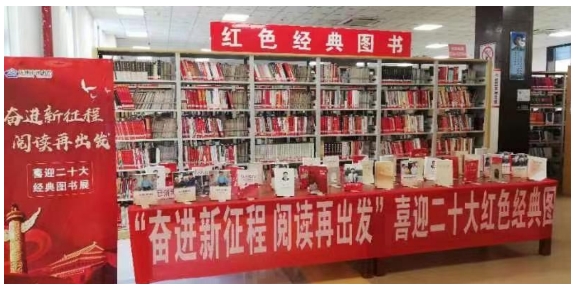
“奋进新征程 阅读再出发” 喜迎二十大经典图书展