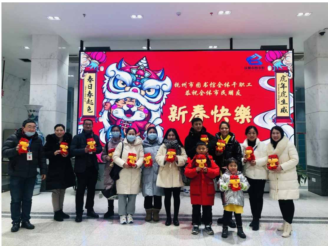
市图书馆一楼大厅开展迎新春送福娃接福气活动