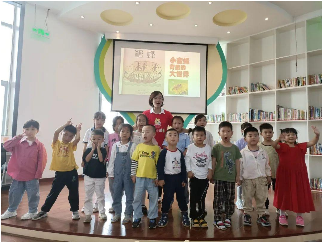
（6月11日上午，在市图书馆二楼数字体验馆开展“小蜜蜂背后的大世界”科普活动）