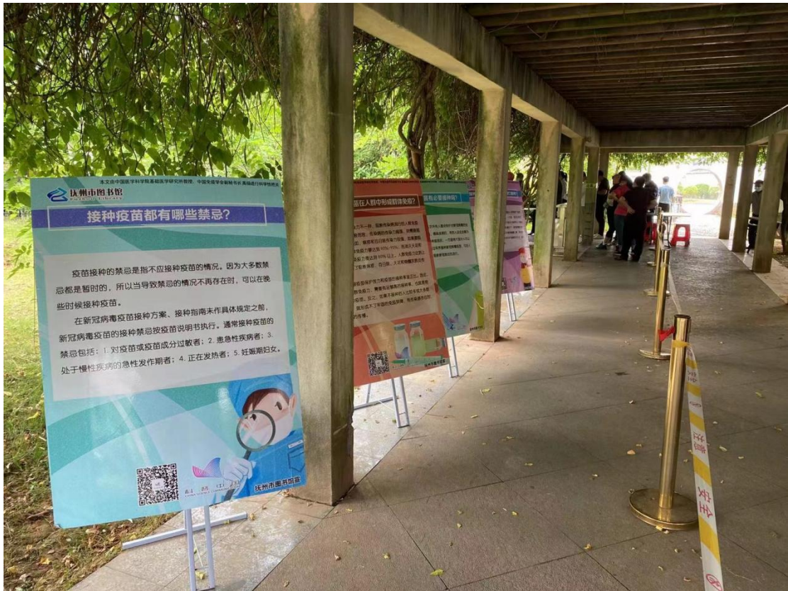
进丰源社区开展科普活动