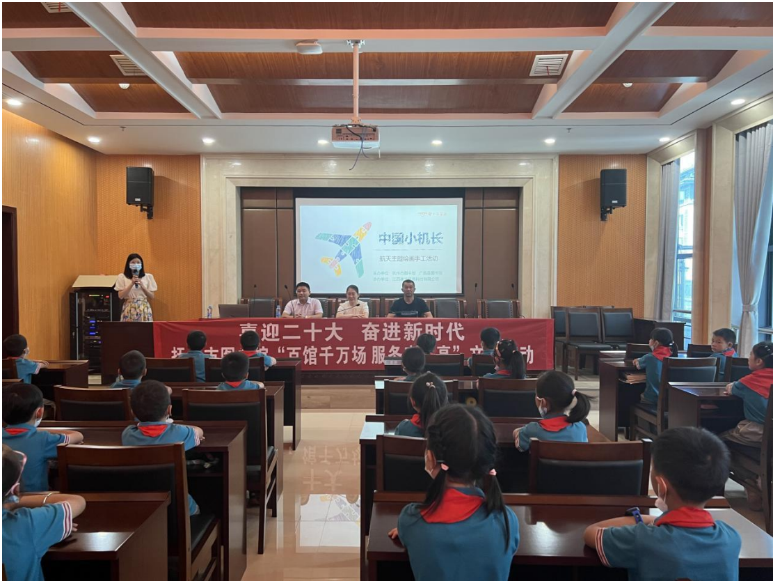
(9月23日上午,在市图书馆二楼数字体验馆开展“喜迎二十大 阅读向未来”中国小机长航天主题科普活动)